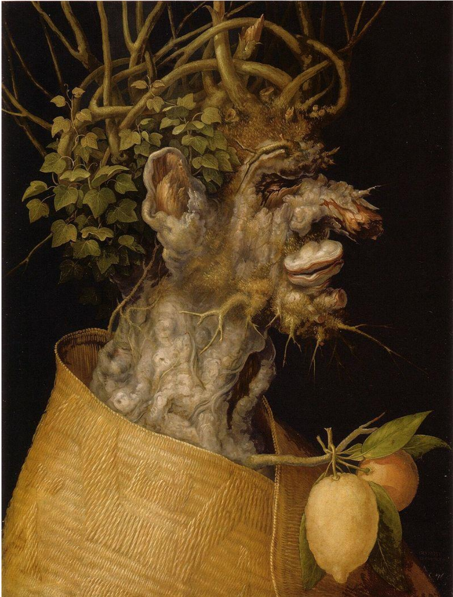
Winter , 1563, Kunsthistorisches Museum, Vienna

Der Winter beraubt uns der Vielfalt an Obst und Gemüse anderer Jahreszeiten. Aber es gibt uns die goldenen Früchte der Zitrusfrüchte! Können Sie zwei solcher Früchte, die in dieser Tabelle erscheinen, markieren und ihre Namen schreiben?