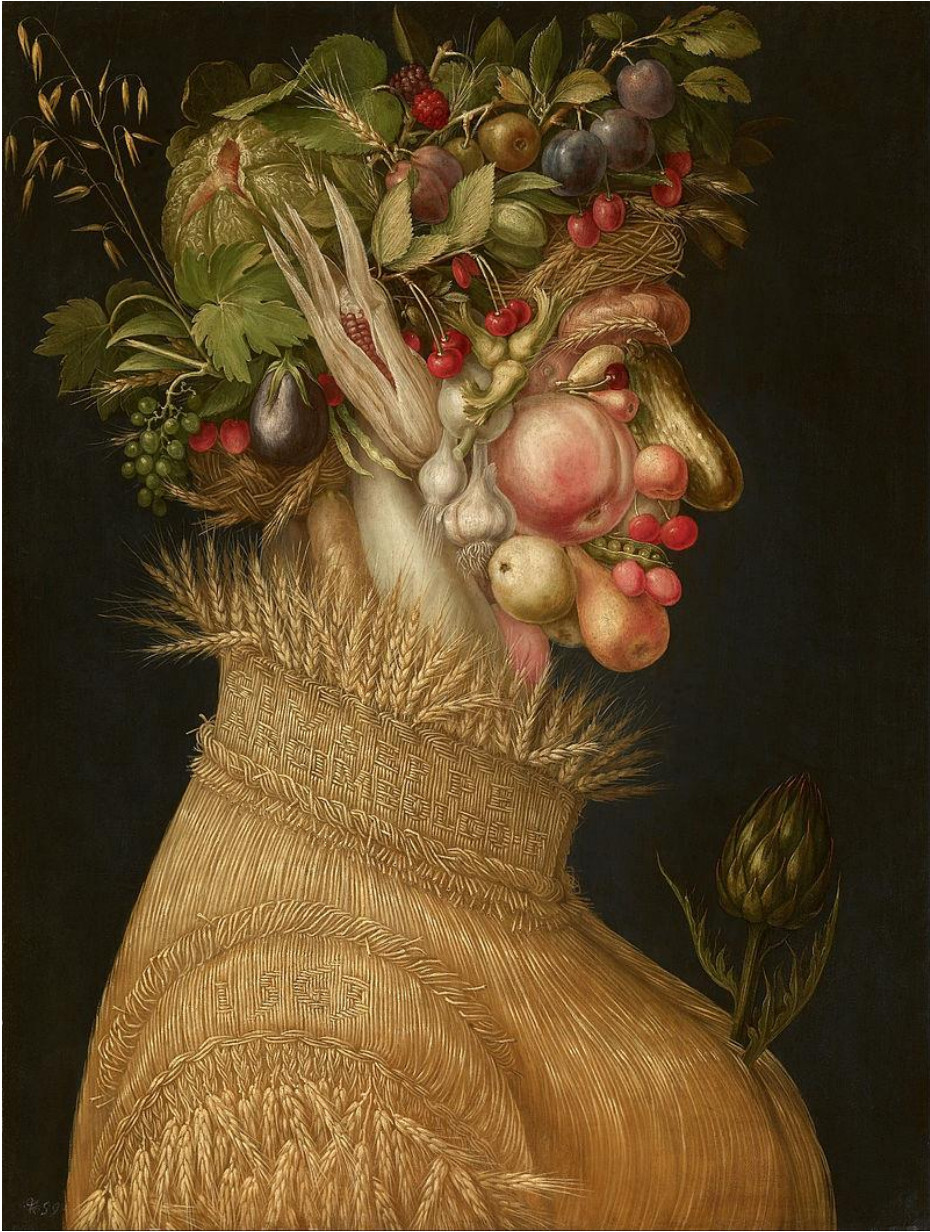
Sommer, 1563, Kunsthistorisches Museum, Vienna

Im Sommer beginnt die Natur, uns ihre ersten Früchte zu geben. Wie viele Obst- und Gemüsesorten unterscheiden Sie? Vielleicht können Sie acht davon aufschreiben und zeigen, wo sie sich auf dem Bild befinden?