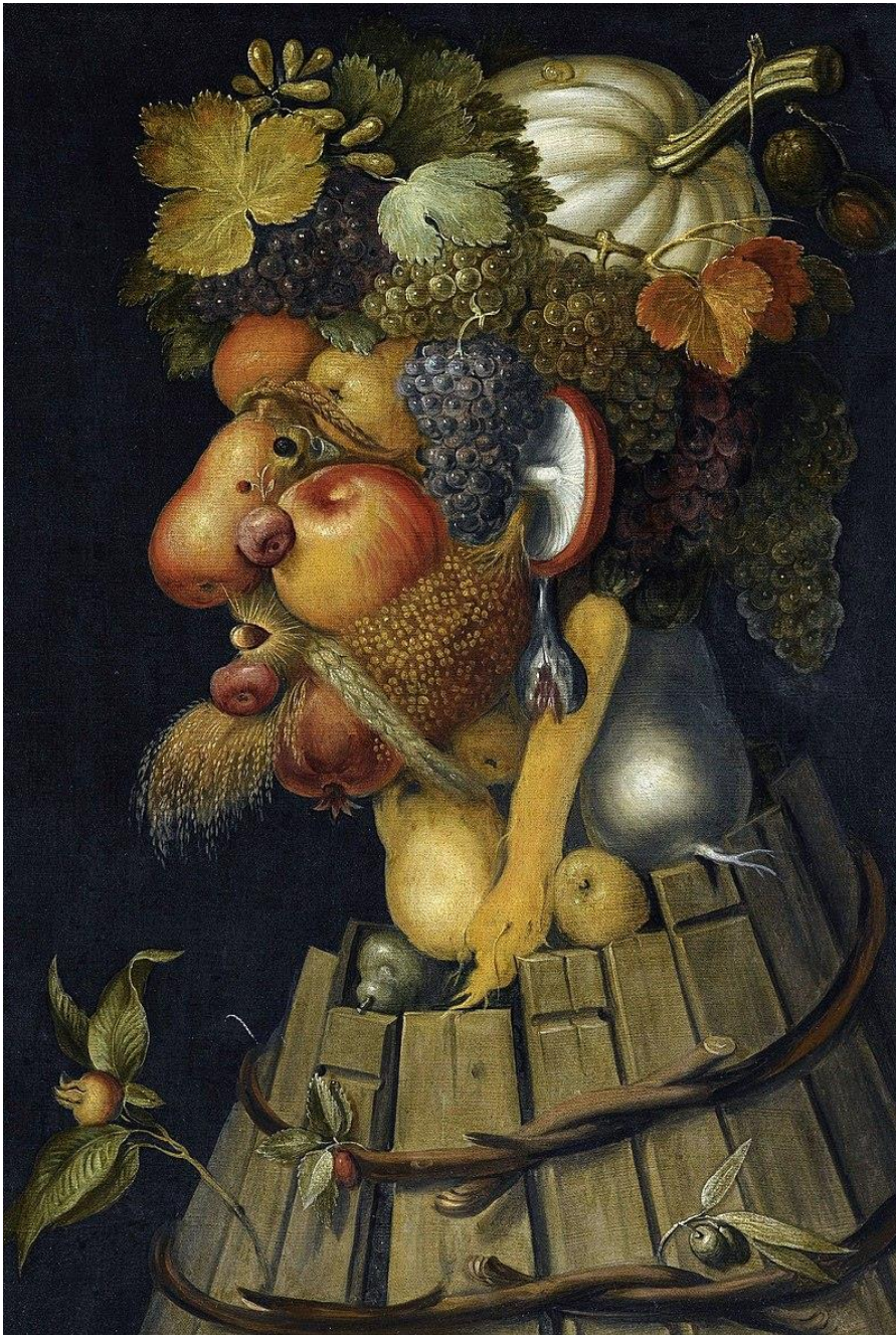
Herbst, 1573, Louvre, Paris

Der Herbst ist die Erntezeit. Wie viele Rebsorten unterscheiden Sie? Vielleicht können Sie sieben der verbleibenden Obst- und Gemüsesorten schreiben und zeigen, wo sie sich im Bild befinden?